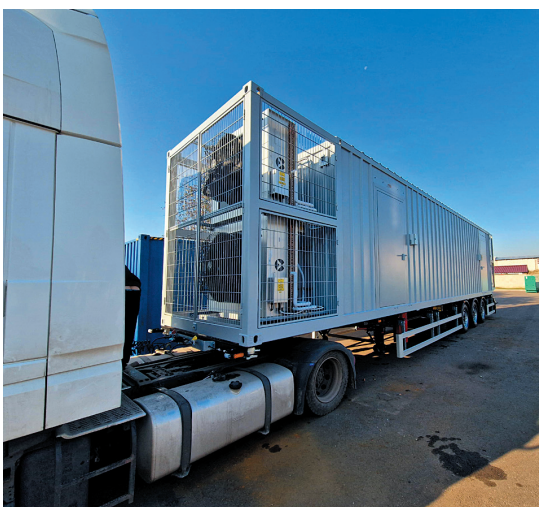
Рис. 1. МЦОД, у якому встановлено ДБЖ Vertiv Liebert APM2

Модульна архітектура Vertiv™ Liebert® APM2 у габаритах 42U-шафи шириною 600 мм дозволяє масштабувати потужність одного пристрою до 600 кВА. Існують два варіанти конструкції: перший має максимальну місткість шафи 30-120 кВА, яка збільшується за допомогою 2U-модулів по 30 кВА (рис. 2), другий – максимальну місткість 60-600 кВА з 3U-модулями по 60 кВА. Система працює в режимі подвійного перетворення з ККД до 97,5%, витримує температури до +50 °C та підтримує «гарячу»